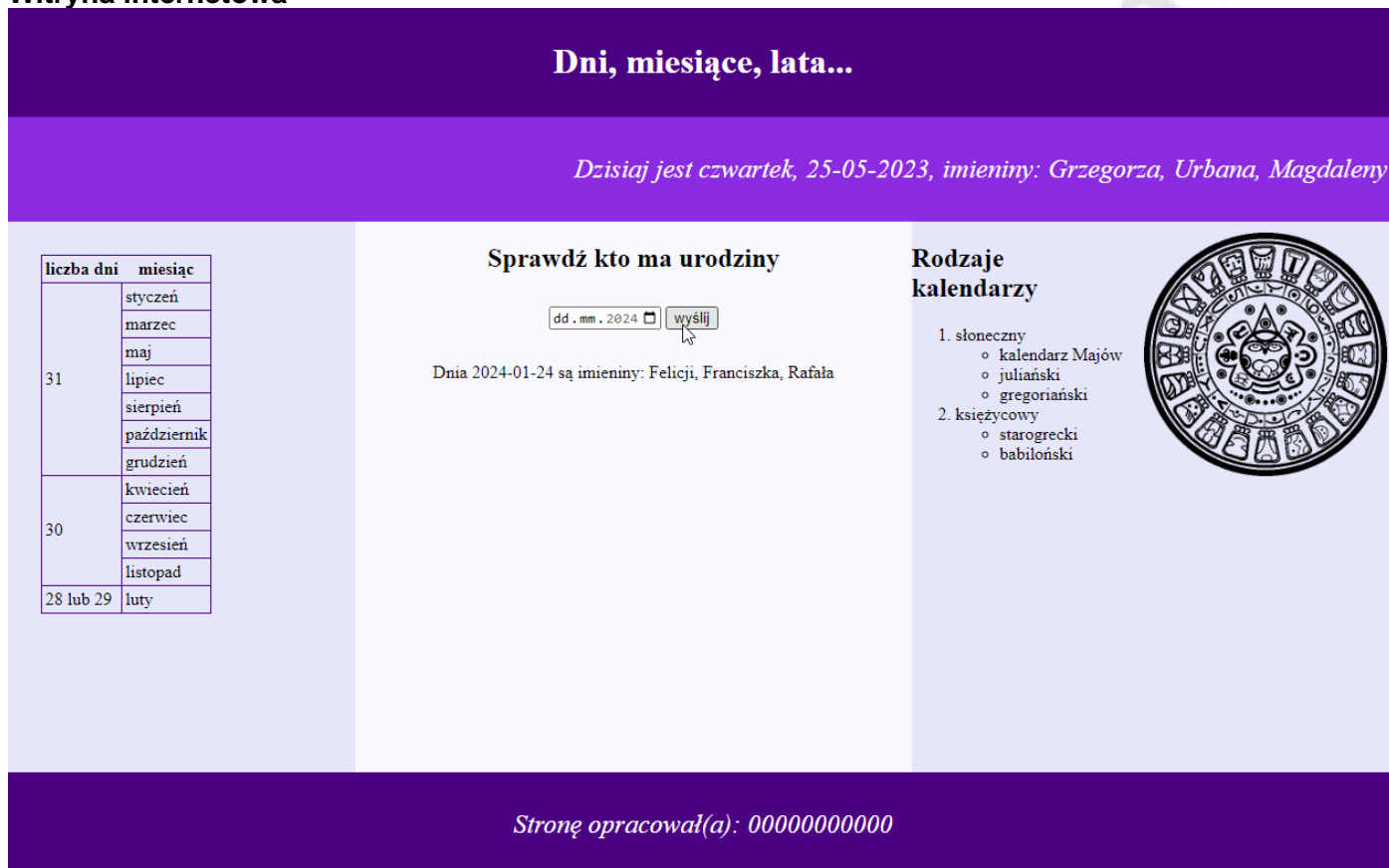
Ilustracja 2. Wygląd witryny internetowej w dniu 2023.05.25, wybrano w formularzu datę 2024.01.24