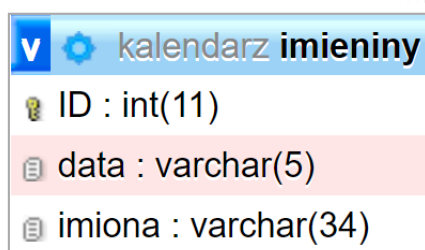
Ilustracja 1. Baza danych

Baza danych zawiera tabelę imieniny przedstawioną na ilustracji 1. Data zapisana jest w formacie mm-dd , np. data 7 listopada zapisana jest jako 11-07.